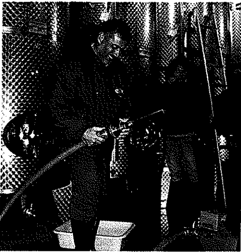
Im Fach Kellerwirtschaft wird auch das sachgemäße Anlegen der Schläuche gelehrt.