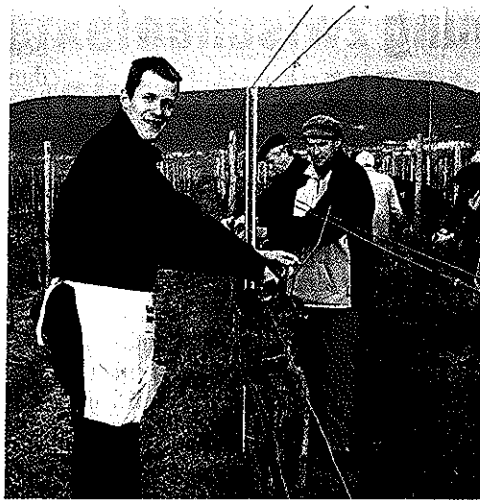
Alle saisonalen Arbeiten im Weinberg werden vermittelt: Hier beim Biegen der Reben.